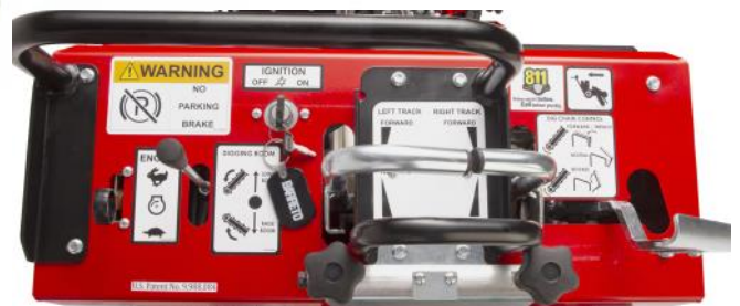
Panel Sólido y Sencillo