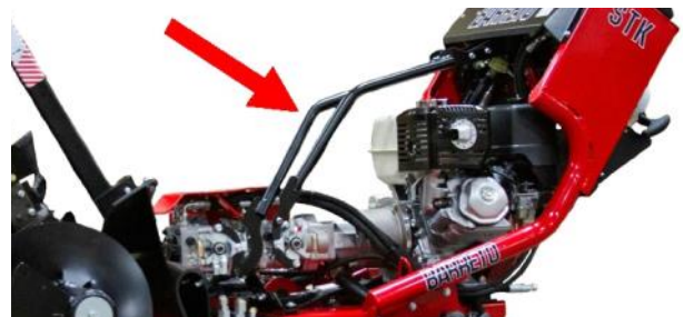
Sin Cables de Transmisión